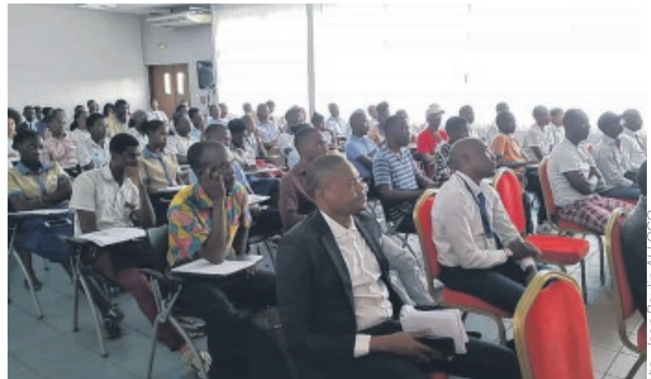
Vue des participants à la conférence

velables. Mais la substitution par des énergies décarbonées prendra du temps. Les capacités de production de pétrole et du gaz risquent d'être insuffisantes, ce qui entraînera des tensions (coûts) et modifiera le paysage géopolitique ", a dit le conférencier en guise de conclusion.